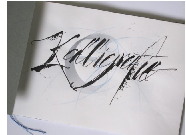
Kalligraphie mit Feder, Brushpen und Fineliner